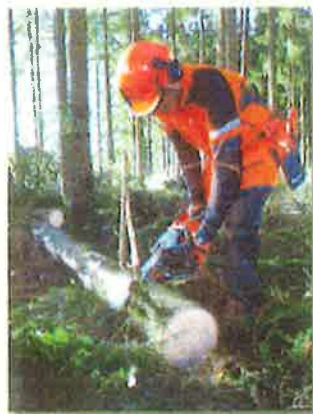
林業・木材製造業労働災害防止協会